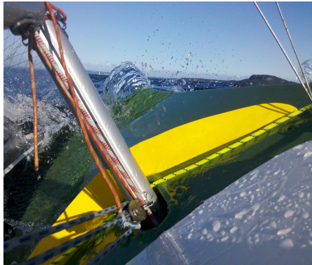
Bra med vind og bølger utenfor Holmestrand.

Opp med seil, og så var jeg i gang... For en følelse, stille, rolig, men samtidig føles det som det går fort (vi sitter jo nesten i vannet, så all fart føles fort), og 40° bank i moderat vind. Synker vi nå!!!! Nei pumpe litt, og på igjen. Det ble vel 10-12 turer både her og i Horten før det ble for kalt høsten 2011.