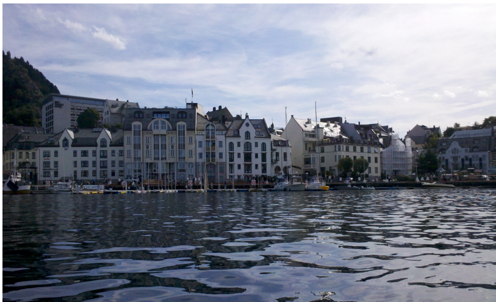
Omgivelsene rundt dette VM 2011 er fantastiske.