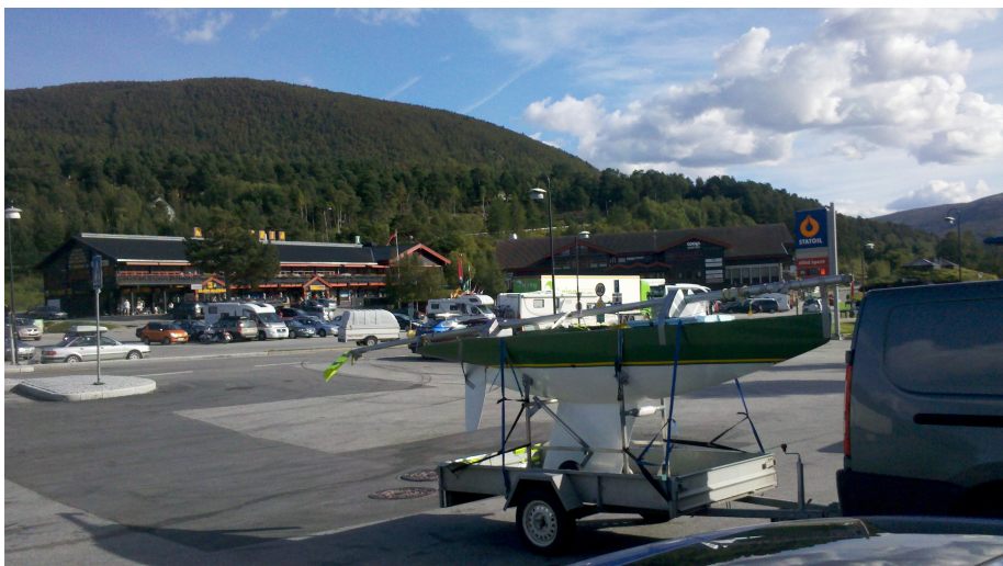
NOR92 på reise.

Våren kom og jeg fikk flere fine turer. Ingen regatta og ingen instruktør, men mye moro. Så sommeren 2011 fant jeg ut at jeg ikke kunne modifisere på den ene 2.4 jeg hadde, til det var jeg blitt alt for glad i seilingen. Så jeg fant NOR92 til salgs, en mye nyere OE III båt. Den så ikke pen ut, men hva så, den var rimelig? Jeg hentet den fra Ålvik, 4uker før VM.