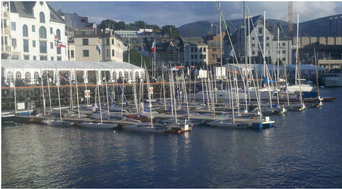
Alle VM båten på plass, nå kan vi starte.